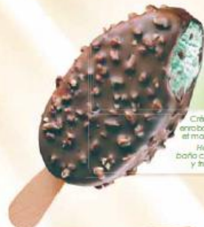
MAESTRO MINT CRUNCH 20 x 100 ml REF.: V07332

Crème glacée vanille sauce fraise, enrobage chocolat blanc et morceaux de biscuits Helado crema vainilla saba fresa baño chocolate blanco y trocitos de galleta