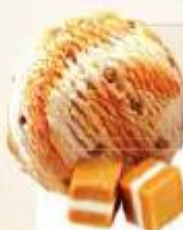
CAMELO CRUNCH 2 x 2,5 L REF.: V07190

Crème glacée pistache avec morceaux de pistaches Helado crema pistacho con trocitos de pistacho