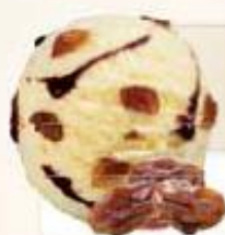
MALAGA 2 x 2,5 L REF.: V07153

Crème glacée crème brûlée, sauce caramel Helado crema quemada salsa caramelo