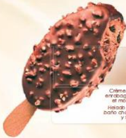
MAESTRO CHOCOLATE & BISCUITS 20 x 100 ml REF.: V07333

Crème glacée chocolat, enrobage chocolat au lait et morceaux de biscuits Helado crema chocolate baño chocolate con leche y trocitos de galleta