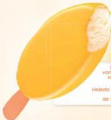
MAESTRO EXOTIC 20 x 100 ml REF.: V07329

Crème glacée menthe, enrobage chocolat au lait et morceaux de chocolat Helado crema menta baño chocolate con leche y trocitos de chocolate