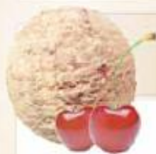
AMARENA 2 x 2,5 L REF.: V07156

Crème glacée vanille et caramel, sauce caramel Helado crema vainilla y caramelo con salsa caramelo