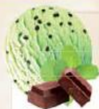
MENTHE CHOCOLAT MENTA CHOCOLATE 2 x 2,5 L REF.: V17040

Crème glacée menthe avec morceaux de chocolat Helado crema menta con trocitos de chocolate