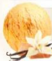
CRÈME BRÛLÉE CREMA QUEMADA 2 x 2,5 L REF.: V17037

Crème glacée vanille avec morceaux de chocolat Helado crema vainilla con trocitos de chocolate