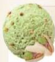
PISTACHE PISTACHO 2 x 2,5 L REF.: V07159

Crème glacée noix avec morceaux de noix Helado crema de nueces con trocitos de nuez