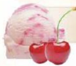
YAOURT YOGUR 2 x 2,5 L REF.: V07160

Crème glacée rhum et raisins au goût rhum Helado crema ron y pasas