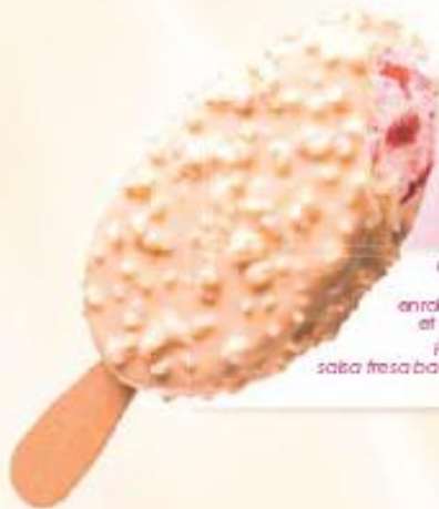
MAESTRO FRESIA & BISCUITS 20 x 100 ml REF.: V07331

Crème glacée caramel, enrobage chocolat au lait et morceaux de biscuits chocolatés Helado crema caramelo baño chocolate con leche y trocitos de galleta con chocolate