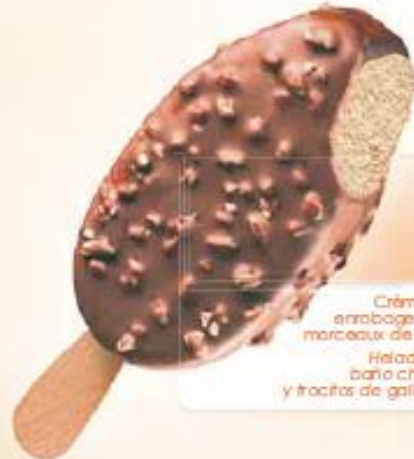
MAESTRO CARAMELO CRUNCH 20 x 100 ml REF.: V07322

Crème glacée chocolat, enrobage chocolat au lait et morceaux de biscuits Helado crema chocolate baño chocolate con leche y trocitos de galleta