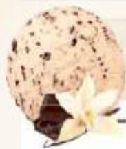
STRACCIATELLA 2 x 2,5 L REF.: V07155

Crème glacée vanille aux fruits des bois Helado crema vainilla con frutas del bosque