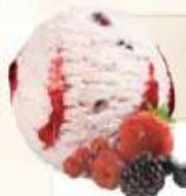
FRUITS DES BOIS FRUTAS DEL BOSQUE 2 x 2,5 L REF.: V07158

Crème glacée vanille sauce cerise Helado crema vainilla salsa cereza