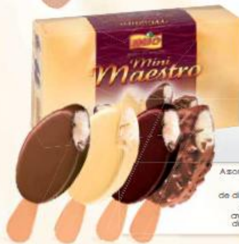
MINI MAESTRO VANILLE/ VAINILLA 12 x 45 ml REF.: V37400

Crème glacée vanille, enrobage sorbet aux fruits exotiques Helado crema vainilla baño sorbete de frutas exóticas