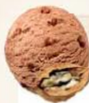
NOIX EXTRA NUEZ EXTRA 2 x 2,5 L REF.: V07149

Crème glacée menthe avec morceaux de chocolat Helado crema menta con trocitos de chocolate